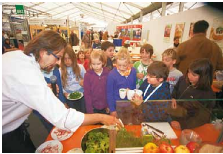
Aus Obst und Gemüse kann man einfach was Tolles zaubern!

Die Meisterinnen der Hauswirtschaft zeigen, wie man in der Küche, beim Waschen und im Wohnumfeld Verletzungen und Gesundheitsgefährdungen vermeidet und stellen ihre kostenlose Einzelberatung zur Haus-